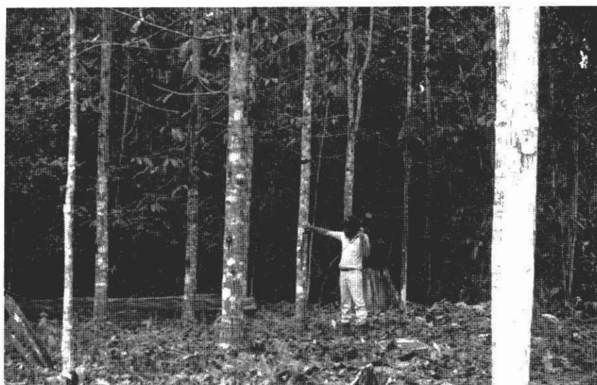
Figura 1. Aspectos dos fustes e da desrama natural de B. excelsa na parte mais sombreada da parcela (parte central). EEST/INPA. Manaus, AM.