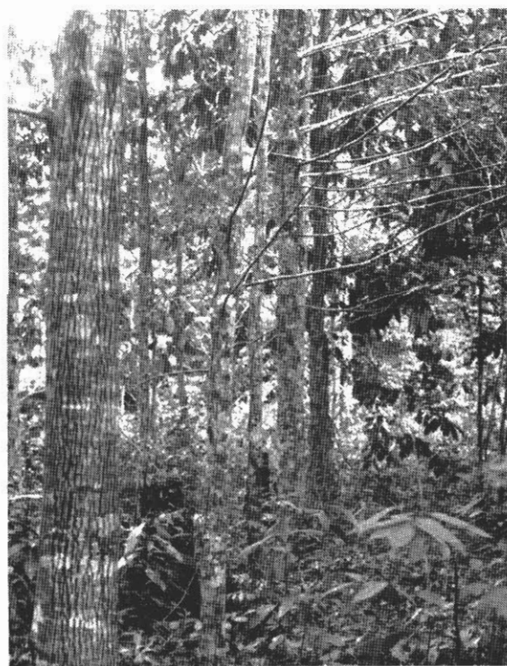
Figura 2. Desrama natural da linha de bordadura de B. excelsa , com ramos vivos (efeito de maior luminosidade). EEST/INPA. Manaus, AM.